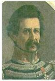
Agustín Codazzi (Italia)