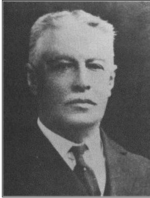
Gral. CARLOS CUERVO MARQUEZ (Colombia)