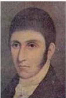
F. J. de Caldas (Colombia)